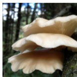
Oesterzwam ( Pleurotus ostreatus )