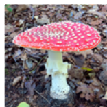
Vliegenschwam ( Amanita muscaria )