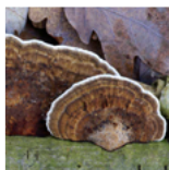
Elfenbankjes ( Trameles versicolor )