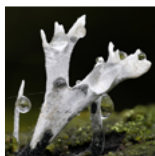
Geweiwam ( Xylaria hypoxylon )