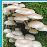
Porseleinzwam ( oudemansiella mascaria )