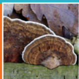
Elfenbankjes ( Trameles versicolor )