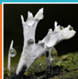
Geweizwam ( Xylaria hypoxylon )