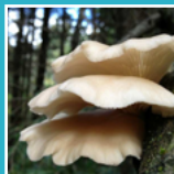
Oesterzwam ( Pleurotus ostreatus )