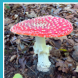
Vliegenzwam ( Amanita muscaria )